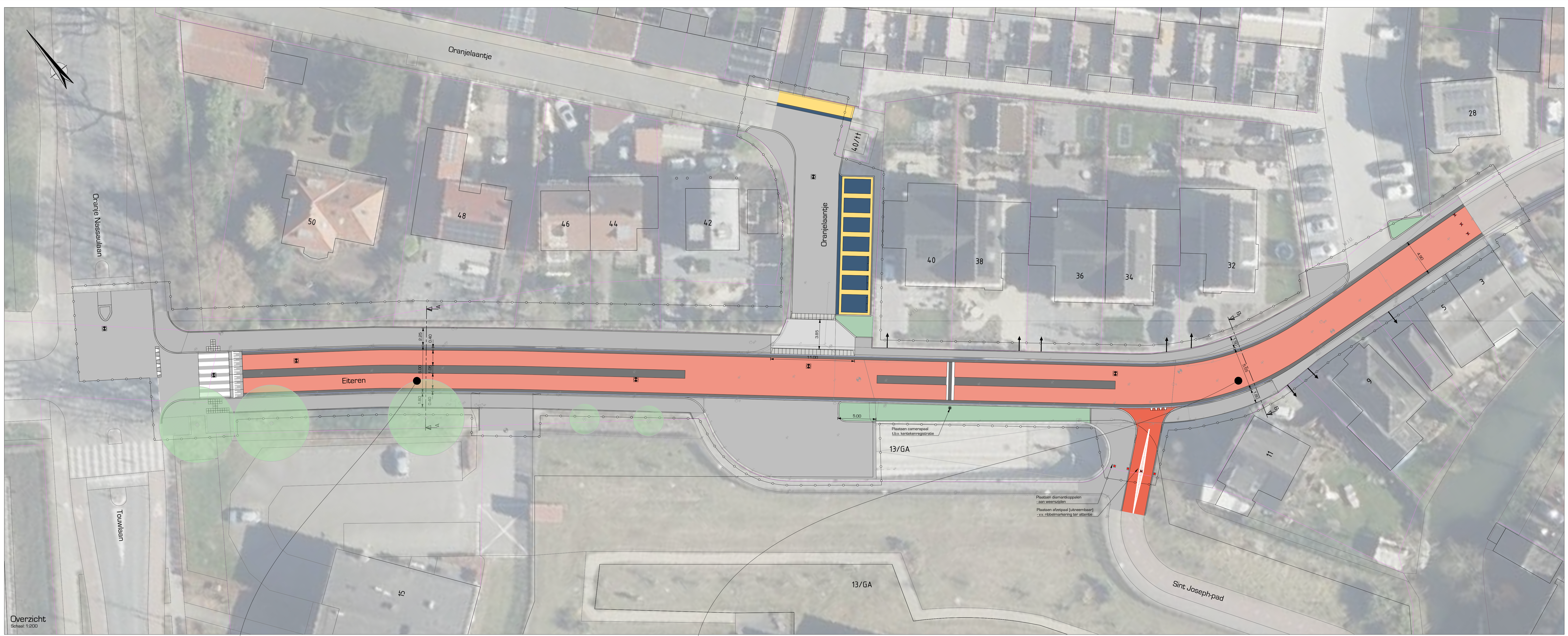
Overzicht Schaal: 1:200